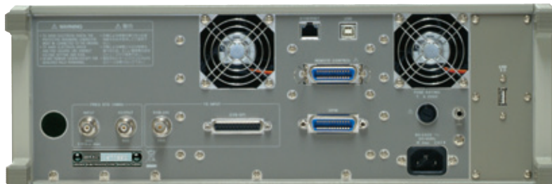
写真はオプション71付です